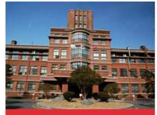
医学校区(大邱中区)