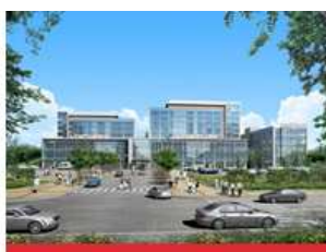
医学校区(大邱北区)