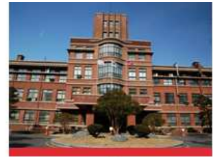
医学校区(大邱中区)