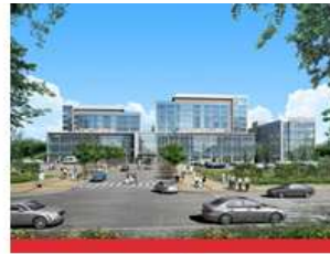
医学校区(大邱北区)