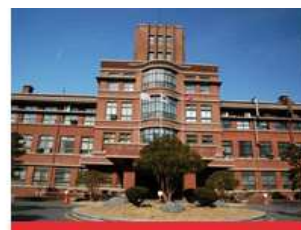
医学校区(大邱中区)