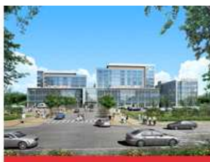
医学校区(大邱北区)