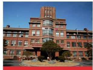
医学校区(大邱中区)