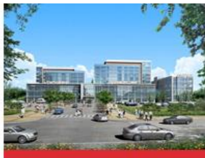
医学校区(大邱北区)